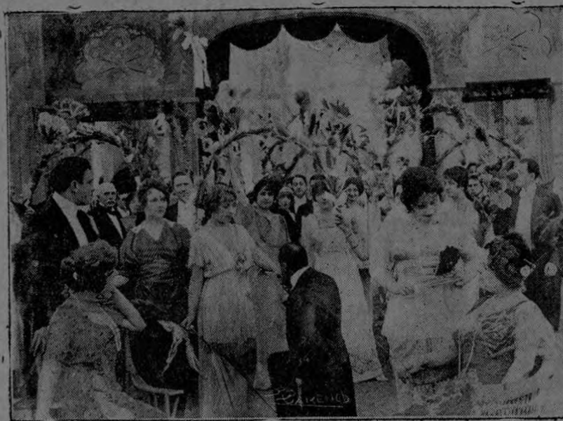
"Las lágrimas del perdón"